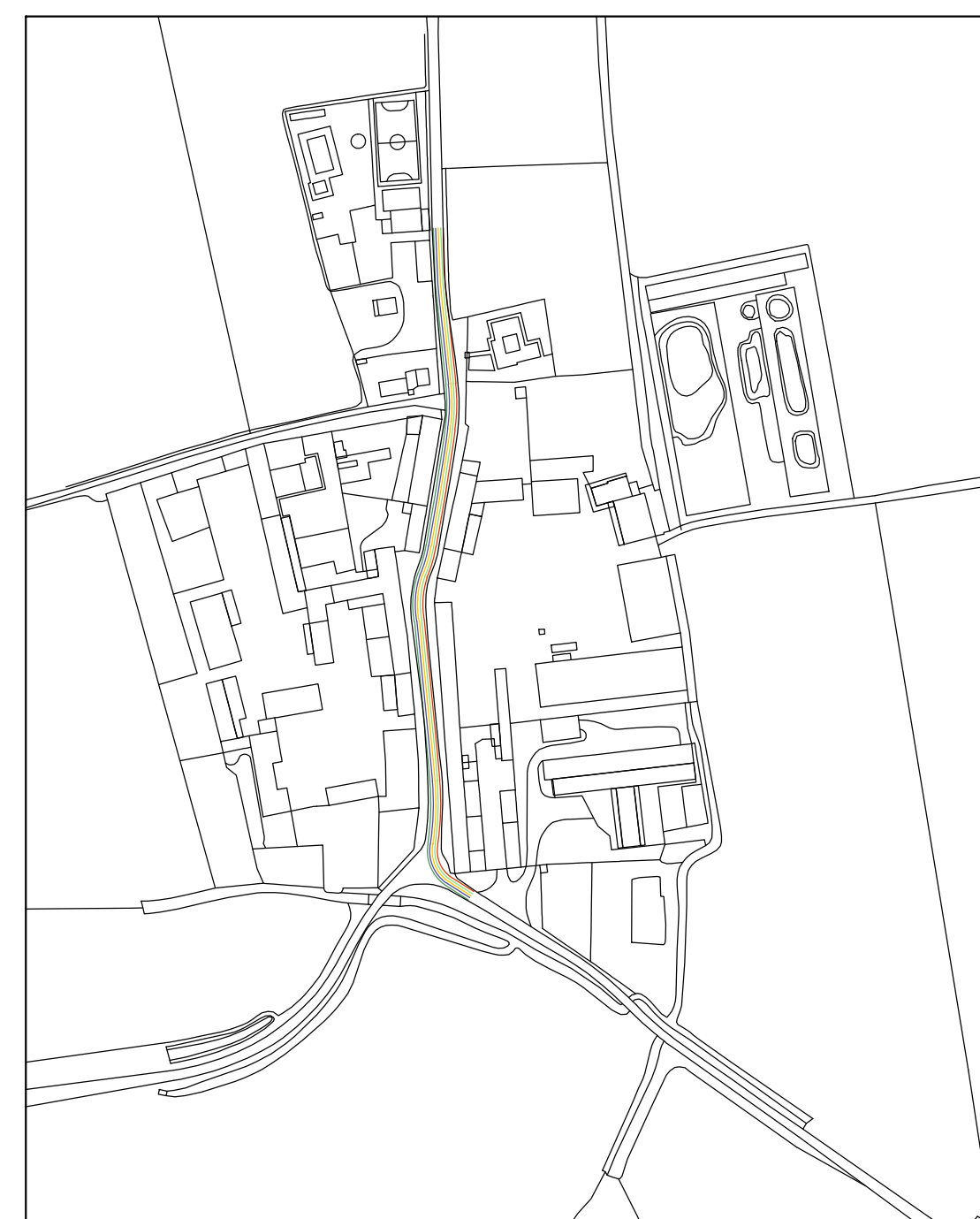
SONCINO – 1:2500